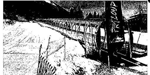
Le tapis des Sorbiers.

« Pra Loup est la pépite de la vallée, il faut la faire briller... » : c'est en ces termes que les élus présents en ce 18 janvier ont qualifié les nouveaux aménagements sur le domaine skiable de la station. Pour sa cinquième année sous la forme de régie, Pra Loup connaît en effet sa troisième saison d'investissements. Cette année, ce sont le TSD6 des Bergeries (Doppelmayr) et le tapis des Sorbiers (Ficap) qui étaient à l'honneur durant cette inauguration ensoleillée. Deux appareils essentiels à la gestion de skieurs en toute fluidité sur deux zones du domaine bien distinctes. Avant un nouvel appareil dès 2013 ?