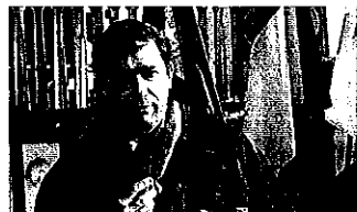
Le député Christophe Castaner.